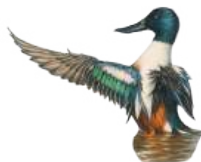
Cuchara ( Spatula clypeata )