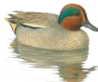
Cerceta común ( Anas crecca )