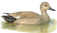
Ánade friso ( Anas strepera )