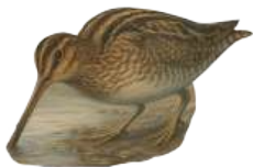
Agachadiza común ( Gallinago gallinago )