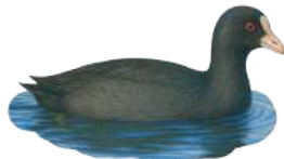
Focha ( Fulica atra )