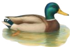
Ánade real ( Anas platyrhynchos )